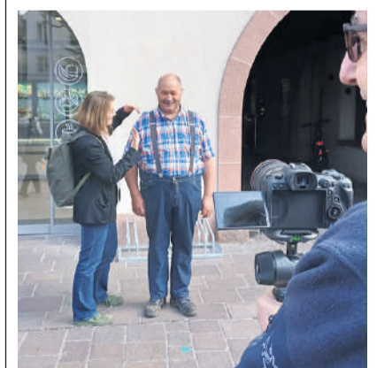
In der Rheinfelder Marktgasse fand die Fotosession statt.

RHEINFELDEN. Das perfekte Bild hilft Wahlen zu gewinnen. Der Fototermin in Rheinfelden soll die Grünen ins rechte Licht rücken. Sie werden mit drei Listen in den Nationalratswahlkampf steigen: 1. Hauptliste, 2. Biobäuerinnen*Liste, 3. Junge Grüne. Die aktuellen Anliegen im Bereich Klima, Soziale Gerechtigkeit, Ernährung und Landwirtschaft werden durch die Kandidatinnen und Kandidaten breit vertreten sein, schreibt die Partei. (mgt)