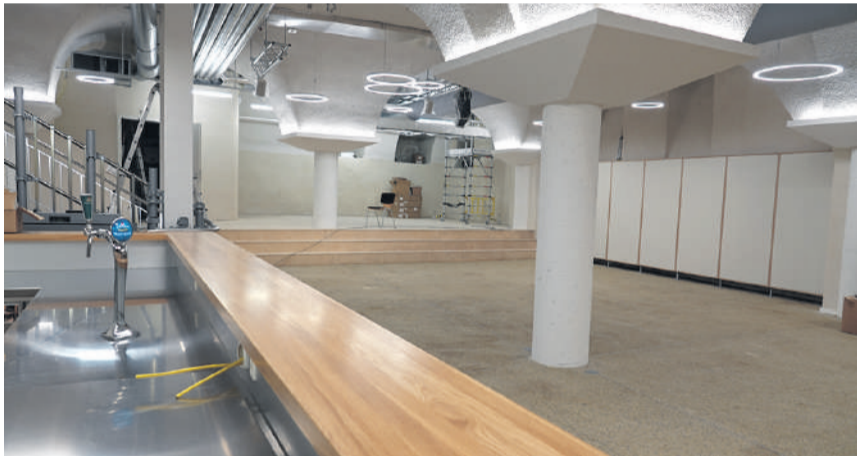
Im aufgefrischten Schützen-Keller sind Konzerte und weitere Kulturveranstaltungen geplant.