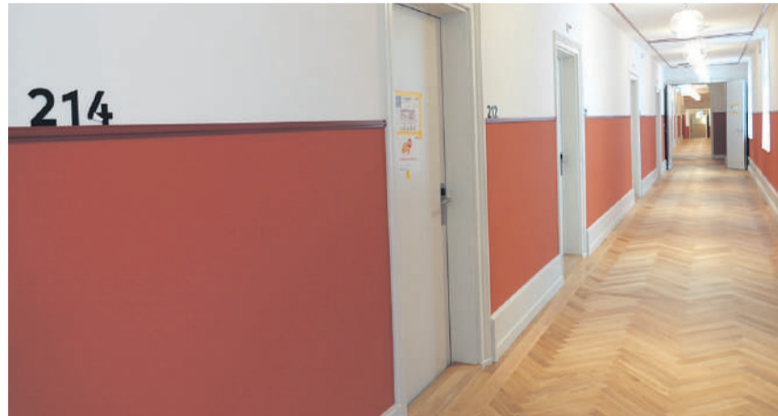
Hotel und Klinik fliessen ineinander.