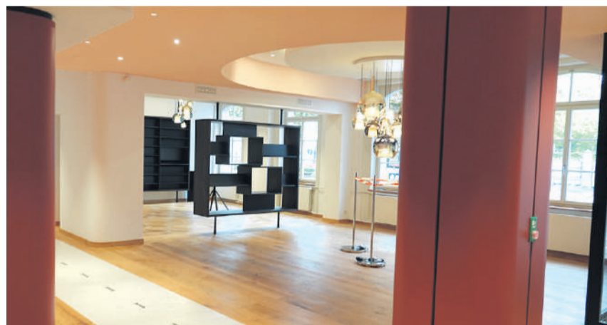
Eine Bibliothek gehört auch zur Lobby.

Die Modernisierung des Hotels und der Klinik Schützen in Rheinfelden hat nicht wie geplant anderthalb Jahre, sondern fast vier Jahre gedauert. Bald kann die Einweihung gefeiert werden.